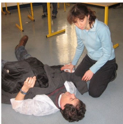
Les personnels de la cité scolaire se sont mis en situation de crise.

Les personnels de la cité scolaire, enseignants et encadrants pédagogiques, ont été invités, sur la base du volontariat, à participer à une formation aux gestes de premiers secours sur une durée de douze heures, réparties en trois jours.