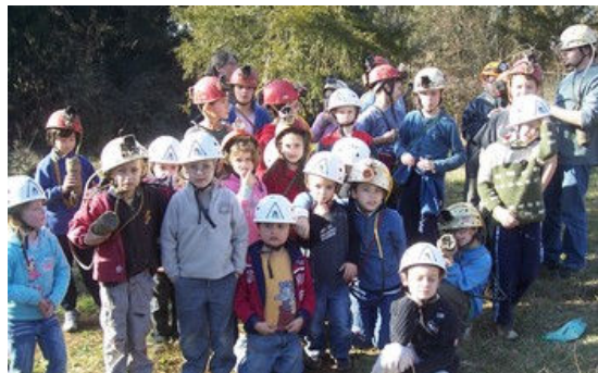
Les enfants ont adoré cette sortie pédagogique.

Sylvie Peytour - Bvd André Dupuy - 05 53 52 21 60