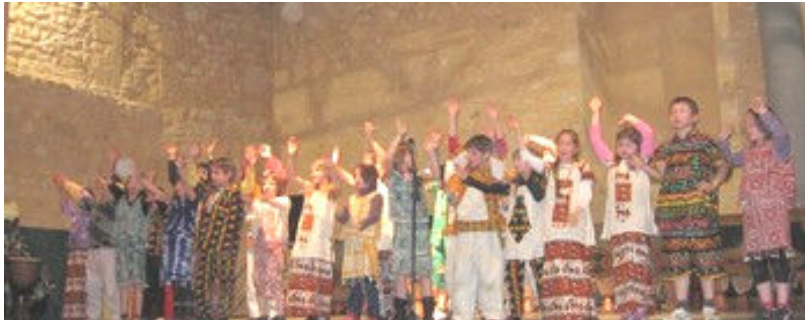
Le spectacle était très bien préparé, les enfants étaient costumés, les animateurs de l'association très dynamique : bref un succès.

Après le défilé, un spectacle complet a été présenté dans la salle du château : danses, chants, poésie et comptines musicales, les enfants avaient « le rythme » et les animateurs de l'association ont assuré l'ambiance, chaude et entraînante.