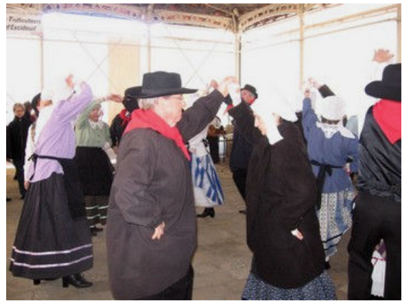
Los Sent German Dau Perigord ont obtenu un franc succès.

La clôture du marché a été fixée au jeudi 13 mars mais les producteurs de gras continueront d'être présents sous la halle jusqu'à la fin du mois.