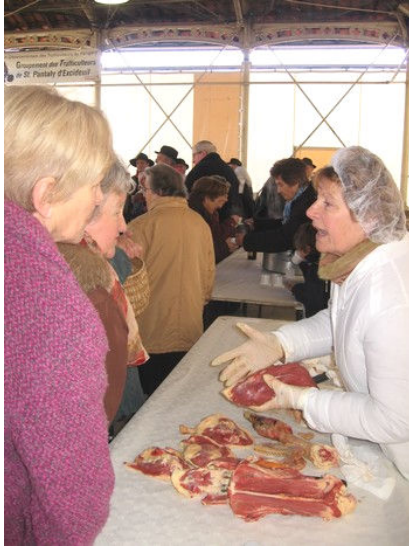
La technique du découpage de canard intéresse toujours les clients.

Le dernier marché primé de la saison n'a pas démerité et a obtenu le même succès que les précédents. Le canard était à l'honneur avec des dégustations et des animations sur ce thème.